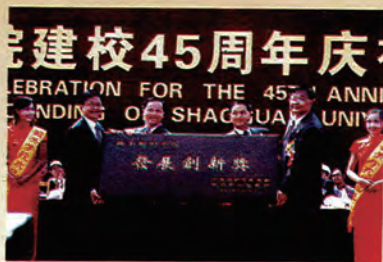
韶关市委书记覃卫东、韶关市市长徐建华向学院赠送牌匾