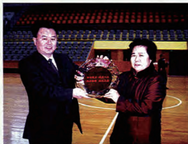
公司支持社会体育事业，副市长杨春芳向公司总经理郑少卿颁发纪念牌

由于信誉卓著，被市政府授予“重合同守信用企业”、市工商局免年检企业、二00二至二00三年度北江区“文明单位”等，是北江区重点民营企业，也是粤北地区第一家通过ISO9001:2000世标认证的房地产开发公司。