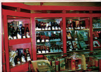
琳琅满目的名酒专柜