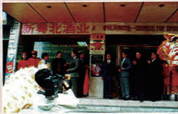
获得市“诚信单位”的新粤北酒业公司