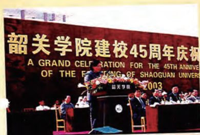
广东省政府副秘书长江海燕代表省委、省政府到会祝贺