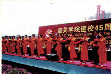
庆典活动剪彩仪式