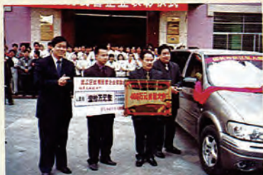
区领导向韶关烟草机械配件厂颁发牌匾