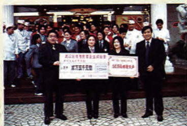
区领导向鸿福山庄颁发牌匾