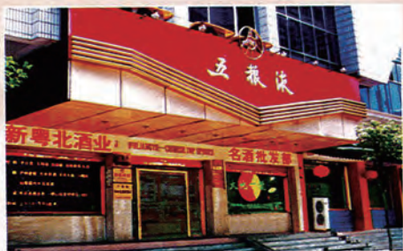
新粤北酒业批发部