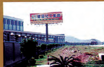
外资企业建滔化工集团