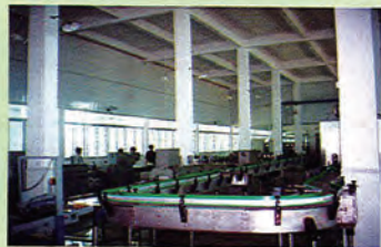
设备先进的现代化生产车间