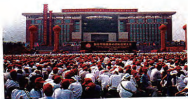
庆祝大会在道平广场隆重举行