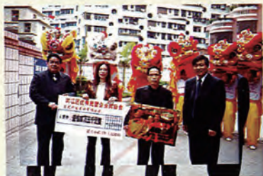
区领导向茗苑开发置业有限公司颁发牌匾