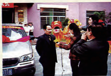
优秀民营企业企业家接受记者采访