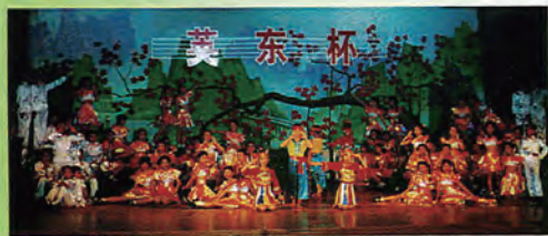
合唱《童谣》获韶关市第八届英东杯“文艺比赛”一等奖