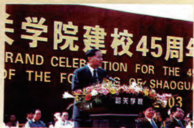
韶关市委书记覃卫东在学院建校45周年庆典仪式上讲话