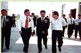
省、市、县领导了解新厂投产情况