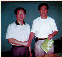
公司热情支持韶关体育事业，赞助首届“市长杯”羽毛球邀请赛。韶关市市长徐建华与公司总经理于化功合影

韶关市广安路灯有限公司是韶关市唯一的、集生产、销售、设计、安装、维护于一体的综合性企业。公司秉承“质量第一、信誉至上、服务周到、节能降耗”的方针，以优质的产品为韶关亮化增添光彩。