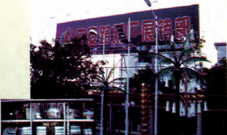
公司展销部及产品