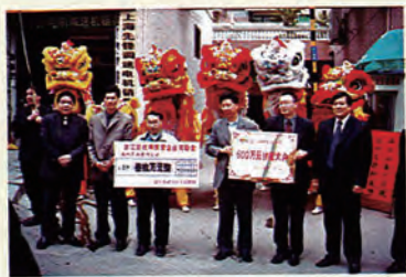
区领导向优秀民营企业南枫置业有限公司颁发牌匾