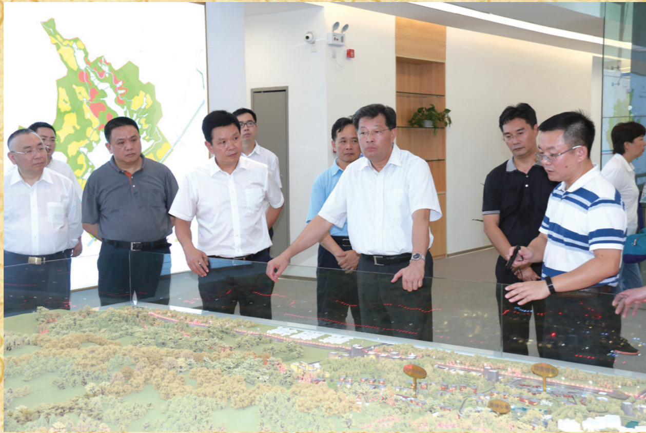
7月24日,省政协副主席林雄率省政协第七视察团,到我市开展产业共建专题调研。市委书记、市人大常委会主任莫高义和市政协主席王青西等市领导陪同调研。