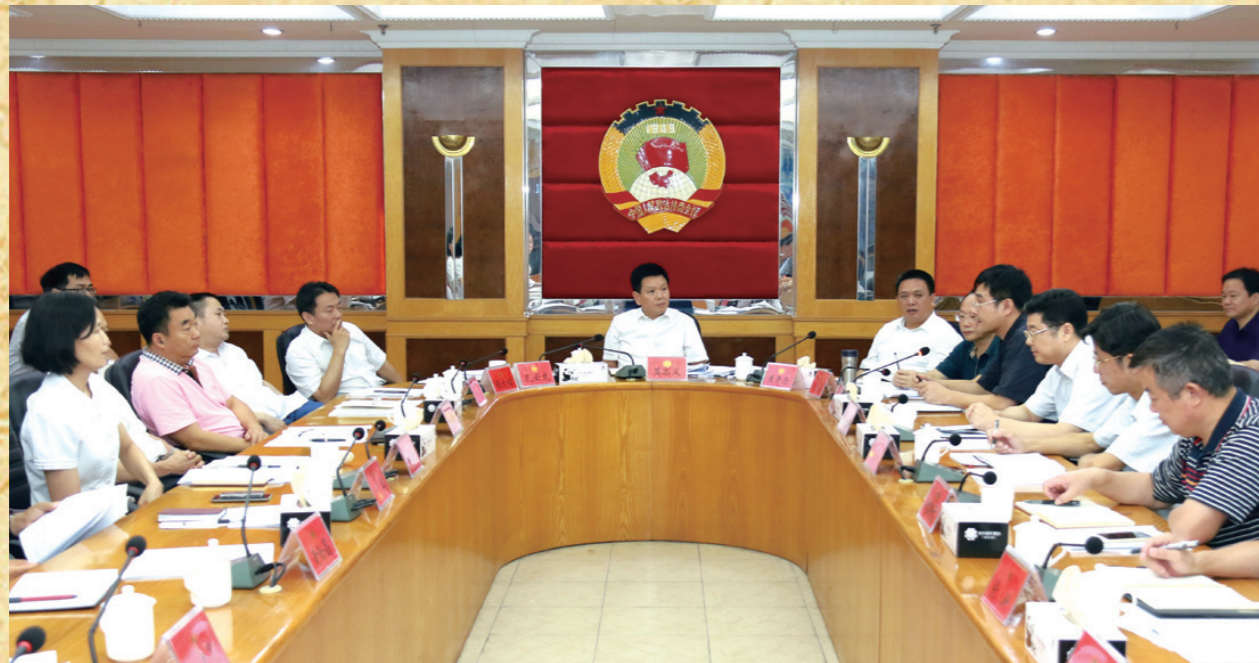
8月4日上午,市委书记、市人大常委会主任莫高义到市政协调研指导工作,并与市政协班子领导及机关干部座谈交流,听取市政协工作汇报及对市委、市政府工作的意见和建议。