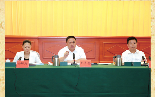
市政协主席王青西在会上讲话。