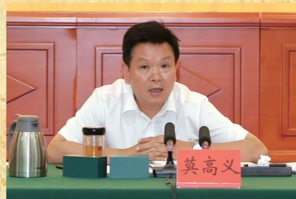
市委书记、市人大常委会主任莫高义主持会议,并作重要讲话。