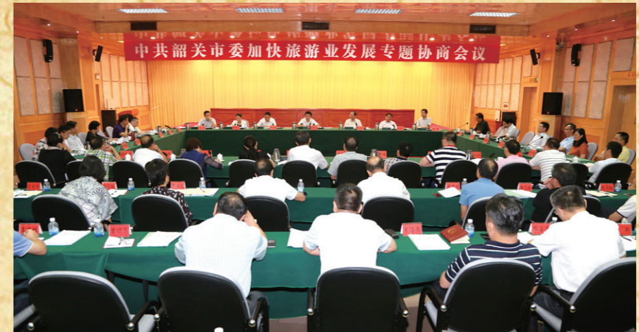
8月23日,市委加快旅游业发展专题协商会议在市委会议中心隆重举行。