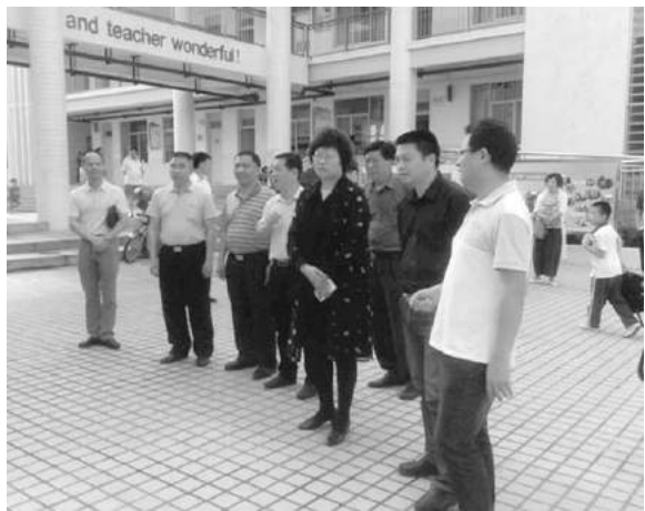
考察组在金湾区外国语学校考察并听取情况介绍。