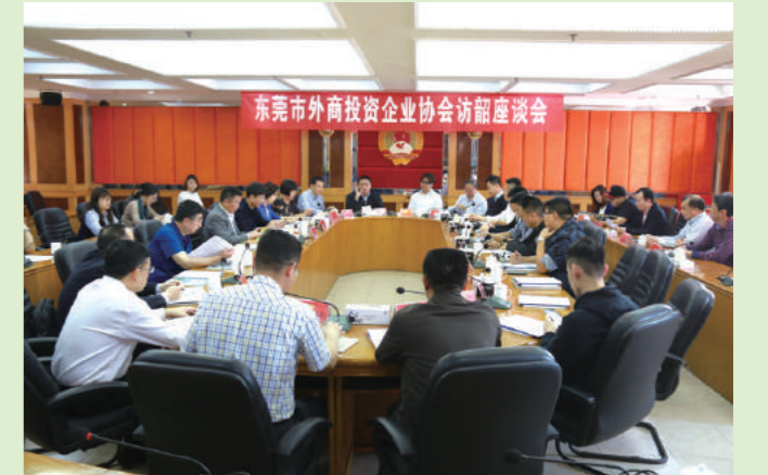
2017年4月28日,东莞外商投资企业协会来韶访问市政协领导。