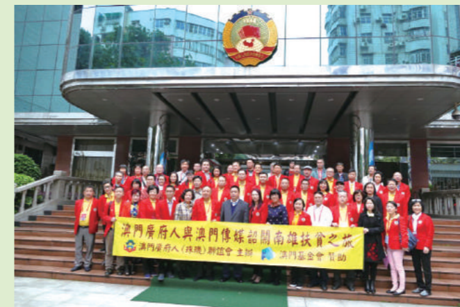
2017年3月24日,澳门广府人(珠玑)联谊会来韶访问市政协领导。