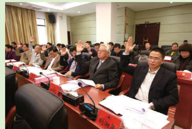
市政协常委们举手表决通过有关事项。