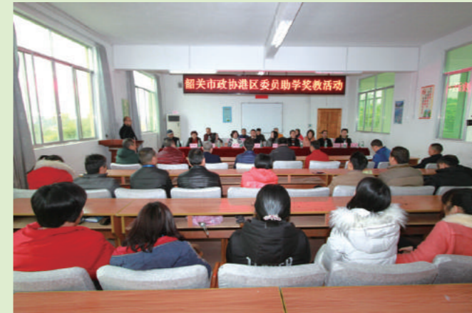
2017年2月25日,市政协港澳区委员到南雄开展助学助教活动。