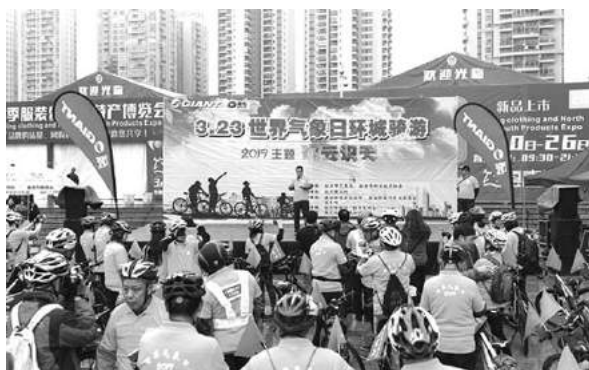
活动启动仪式现场

通过此次活动,让公众不仅学习到了气象科普类知识,更提高了公众科学应对气候变化的意识,将气候变化带来的不利影响降到最低。(市科协)