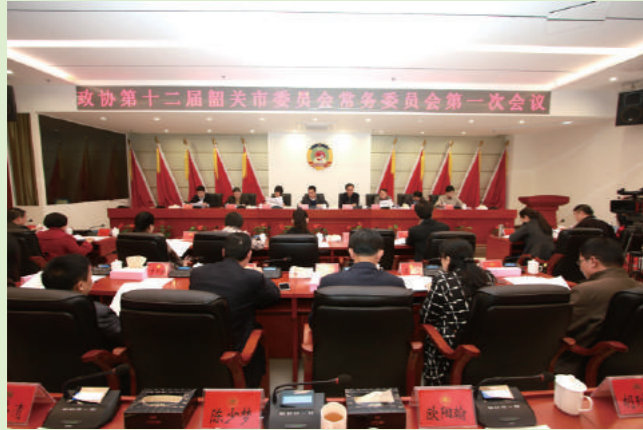
市政协十二届一次常委会议现场。