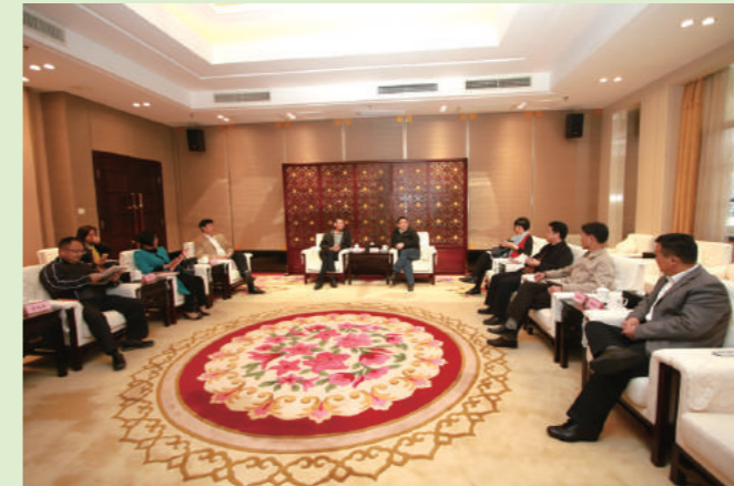
2017年4月12日,市政协王青西主席与清远市政协主席梁志强一行座谈交流。