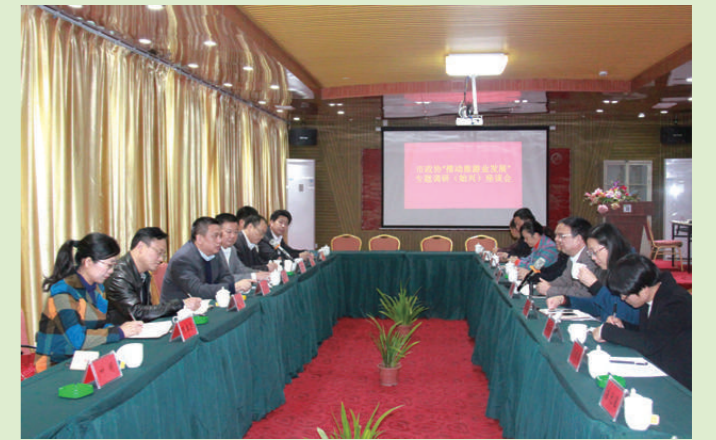
2017年3月22日,市政协主席王青西带队到始兴调研旅游业发展情况。